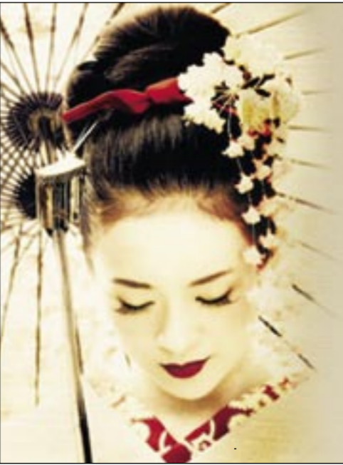
صورة من كتاب «عمر الزعني»

بسبطة جداً ومعقدة جداً جداً ضعيفة جداً وقوية جداً جداً متناقضة وحبوبة لا يمكن العيش معها بسلام واملئثان ولا يحلو العيش بدونها مهما كان